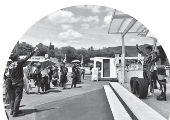
モータースポーツグッズなどの 抽選会やチャリティーオークション じゃんけん大会など 色々なイベントを開催予定！