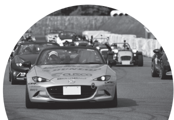
全日本ジムカーナ選手会 (AJGA) の協力により 5/11(日)第2ヒート終了後に 抽選でジムカーナ車両での同乗走行と 小中学生対象のパレードランを行います