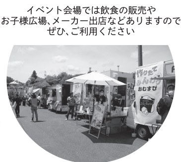
イベント会場では飲食の販売や お子様広場、メーカー出店などありますので ぜひ、ご利用ください