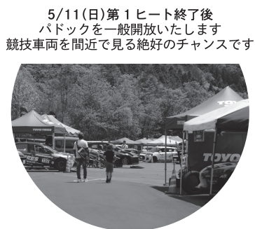
5/11(日)第1ヒート終了後 パドックを一般開放いたします 競技車両を間近で見る絶好のチャンスです